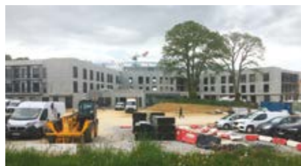
La charpente métallique qui relie les deux ailes du H