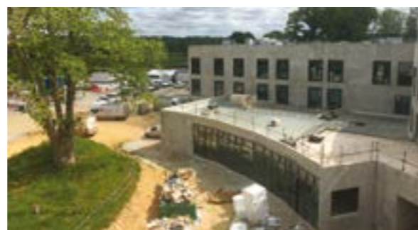
La future entrée de l'hôpital