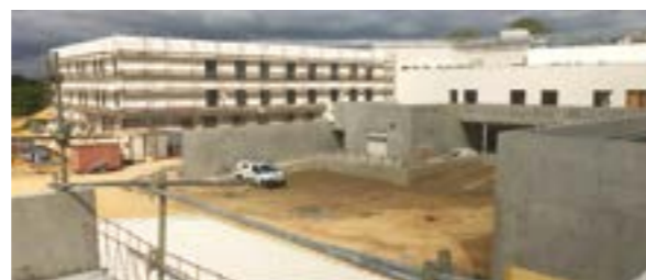
Le gros-œuvre de l'hôpital est terminé