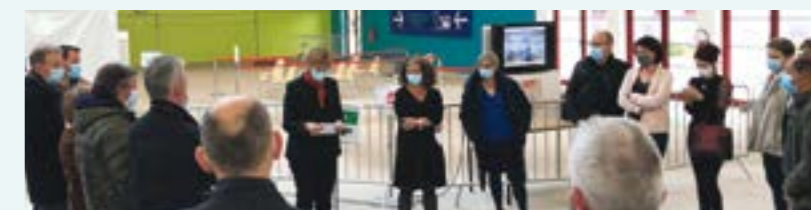
Cérémonie de clôture du centre de vaccination à la Halle Safire le 31 mars 2022.